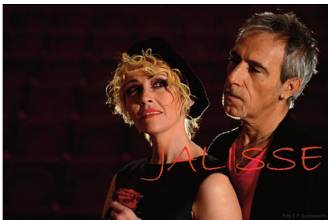
Jalisse Direttori artistici DOCMusiccontest